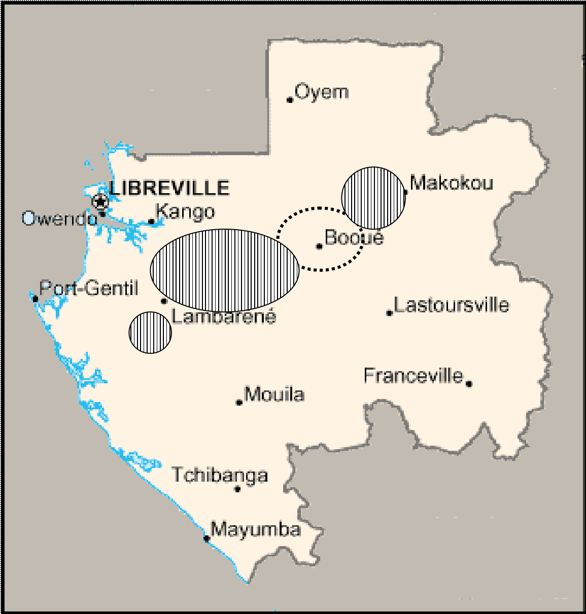
Carte Localisation des Makina et zones d'interactions avec les Fang et les Saké